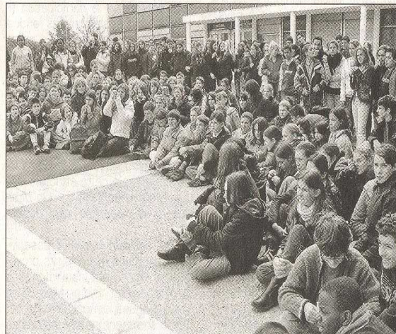
Les collégiens en nombre pour partager l'aventure.