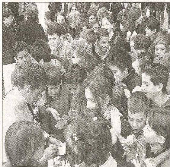
Des stars de rock ?